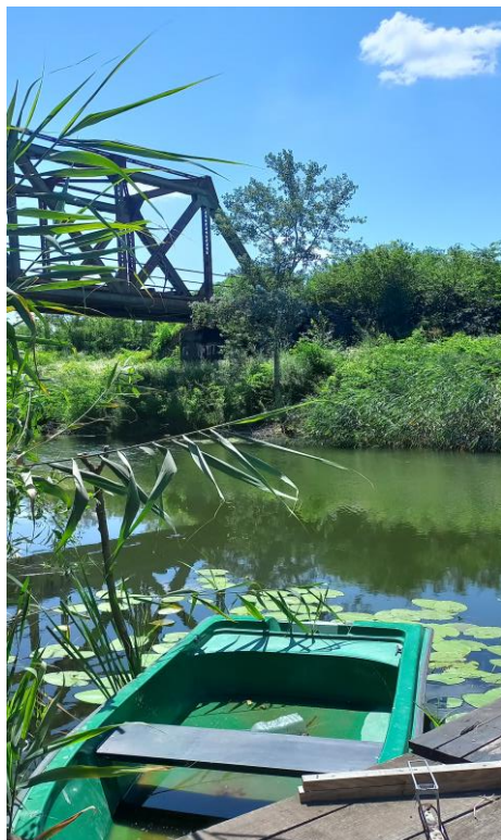
Most Staparski put